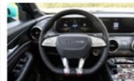
Equipamiento incluido •

Nos reservamos el derecho de actualizar, cambiar o reemplazar cualquier especificación sin previo aviso